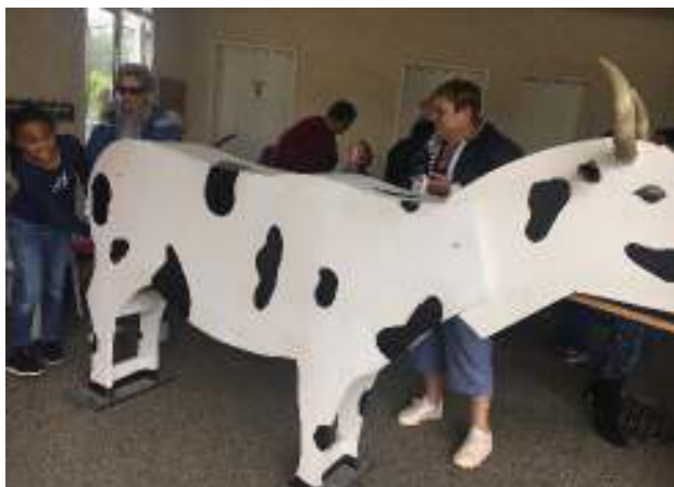
La fête 2019

Des emplacements sont encore disponibles, vous pouvez vous inscrire lors de la permanence au bureau de l'AFAC, à la mairie le Samedi 7 septembre de 9h00 à 11h30. Le dossier d'inscription est téléchargeable sur le site saint-germain-de-la-grange.net