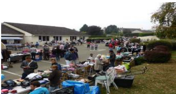
L'animation du vide-greniers